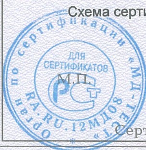
Схема сертификации 2.

Протокола проверки результатов услуг № 190434 от 12.09.2019