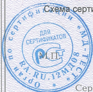
Схема сертификации 2.

Протокола проверки результатов услуг № 190372 от 04.09.2019