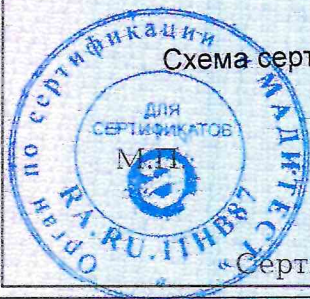
Схема сертификации 2.

Протокола проверки результатов услуг № 220133 от 30.03.2022