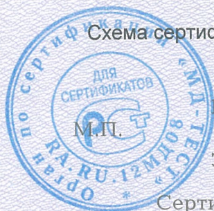
Схема сертификации 2.

Протокола проверки результатов услуг № 190121 от 01.04.2019