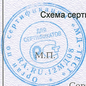
Схема сертификации 2.

Протокола проверки результатов услуг № 190453 от 14.09.2019