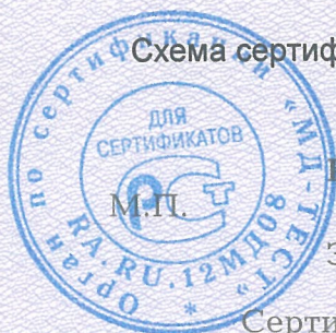
Схема сертификации 2.

Протокола проверки результатов услуг № 190419 от 14.09.2019